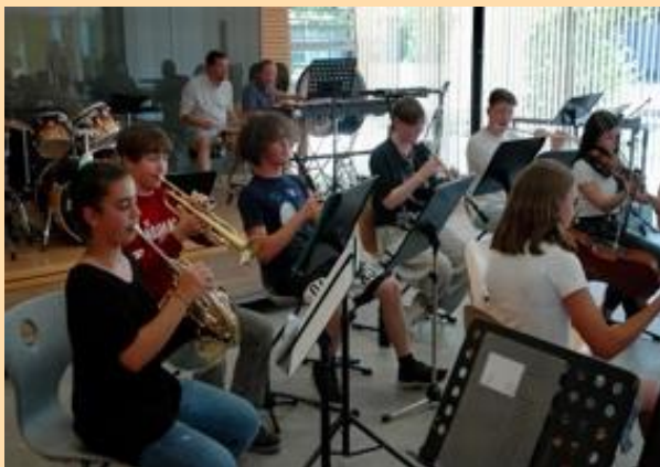
Aufführung der Musiker