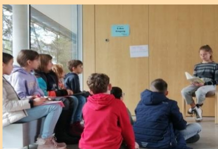
Vorlesetag Klasse 5

Der Aufenthaltsraum am KGT befindet sich im Hauptgebäude und ist ab 7.00 Uhr geöffnet.