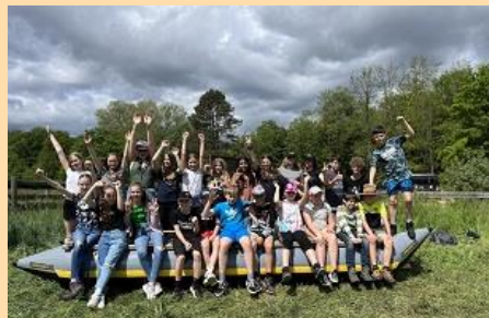
Landschulheim Klasse 6